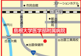
2 島根大学医学部附属病院 出雲市塩冶町89-1 ☎20-2388