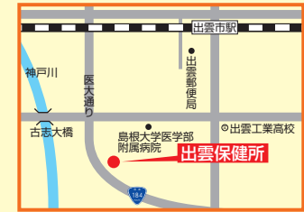
13 出雲保健所 出雲市塩冶町223-1 ☎21-1653