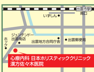
8 心療内科 日本ホリスティッククリニック 漢方佐々木医院 出雲市塩冶善行町14-1 ☎25-1311