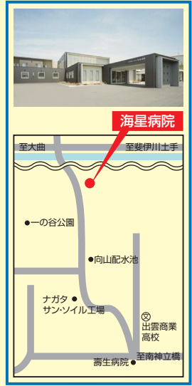
5 海星病院 出雲市大津町3656-1 ☎21-3521