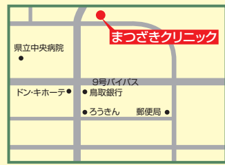
10 まつぎクリニック 出雲市姫原4丁目10-2 ☎31-7700