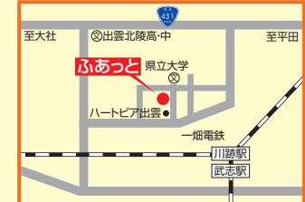
14 地域生活支援センターふあっと 出雲市武志町693-1 ☎25-0130