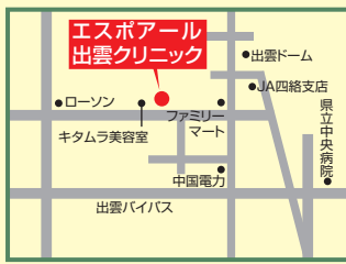
7 エスポアール出雲クリニック 出雲市小山町361-2 ☎21-9779