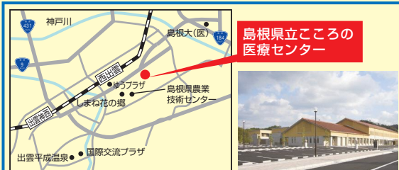
4 島根県立こころの医療センター 出雲市下古志町1574-4 ☎30-0556