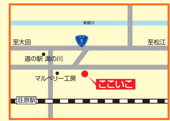
15 地域活動支援センターここいこ 出雲市斐川町学頭1625-4 ☎72-7085