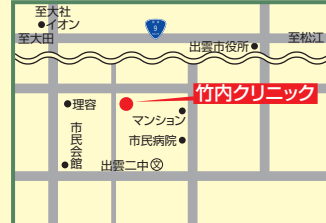
9 竹内クリニック 出雲市塩冶町1466-1 ☎23-8686