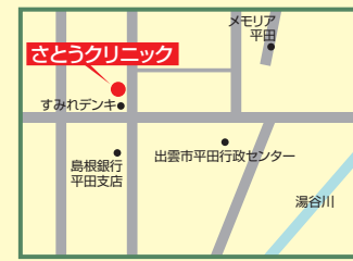
12 さとうクリニック 出雲市平田町989-1 ☎62-4311