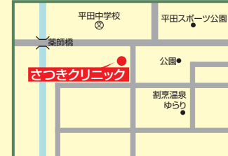
11 さつきクリニック 出雲市平田町2944-20 ☎63-5601