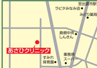
6 あさひクリニック 出雲市塩冶町950-2 ☎20-1058