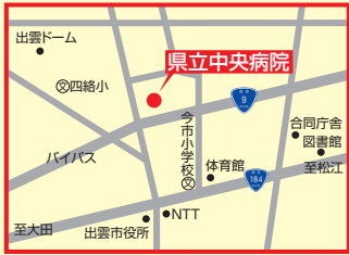
1 島根県立中央病院 出雲市姫原町4-1-1 ☎22-5111