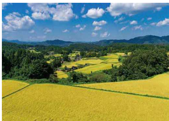
第33回優秀賞 福頼棚田 (奥出雲町大呂)

優れた景観を形成している建物などを表彰することにより、県民の景観に対する意識高揚を図るため、「しまね景観賞」を実施しています。平成5年度に創設し、令和8年度で34回目を迎えます。