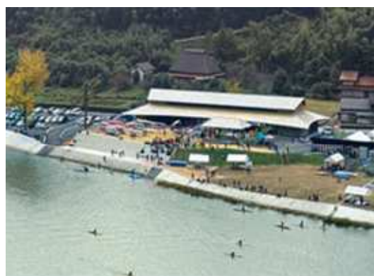
第33回優秀賞 カヌーパークみさとカヌーレ IMAI (美郷町信喜)