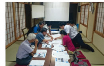
鍛冶橋、国道431号説明会の様子