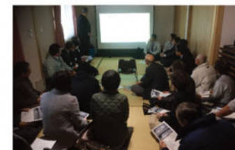
新大橋説明会の様子