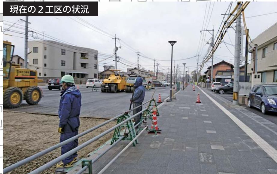
現在の2工区の状況