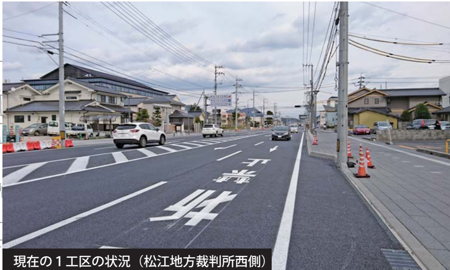
現在の1工区の状況（松江地方裁判所西側）

松江鹿島美保関線の交差点から裁判所西側交差点までの区間において平成29年3月に部分供用を開始しました。これまで西へ向かう車両が交差点部で右折車の影響を受け、渋滞が発生していましたが、右折車線が設置されたため直進車がスムーズに通行できるようになりました。