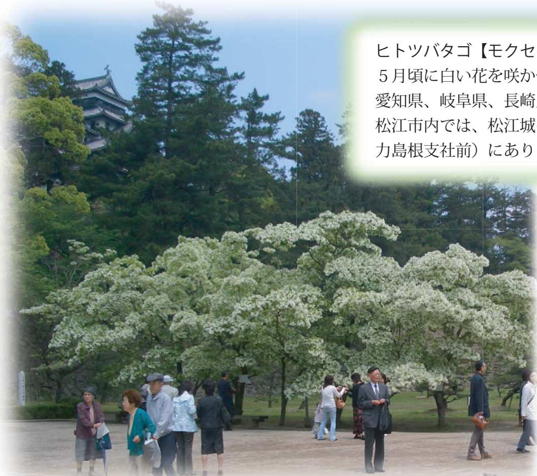
松江城二ノ丸のなんじゃもんじゃ（5月上旬頃）

ヒトツバタゴ【モクセイ科・広葉落葉樹】 5月頃に白い花を咲かせる。花には芳香がある。 愛知県、岐阜県、長崎県対馬市に自生する珍木。 松江市内では、松江城の他に東京橋北側（中国電力島根支社前）にあります。