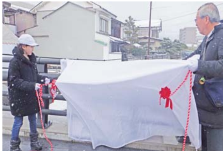
橋名板がついにお目見えです

松江県土整備事務所 tel 0852(32)5755 松江市役所歴史まちづくり部 都市政策課 tel 0852(55)5373