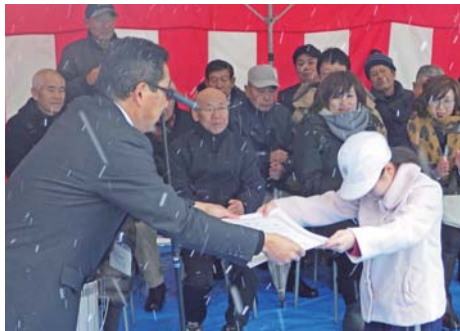
自治会の皆さまに見守られながら感謝状の贈呈