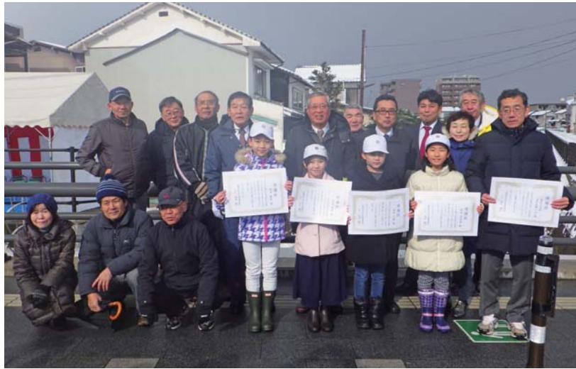
雪の降りしきる中での開催となりましたが、お目見えした橋名板に笑顔あふれる式典となりました ご参加いただきました皆さま、ありがとうございました