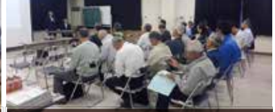
平成29年5月16日(火) 持田公民館