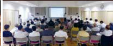
平成29年5月23日(火) 古江公民館