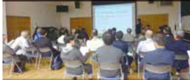
平成29年5月17日(水) 法吉公民館