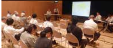
平成29年5月22日(月) 川津公民館