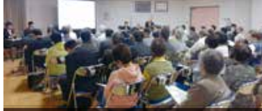
平成29年5月15日(月) 生馬公民館