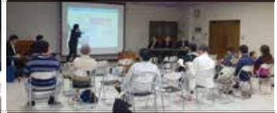
平成29年5月18日(木) 城北公民館