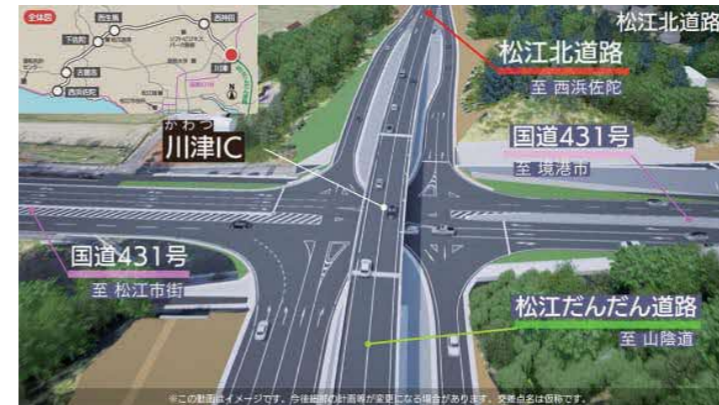
▲川津インターチェンジ