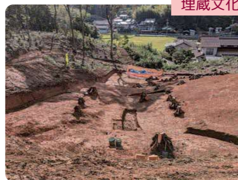
埋蔵文化財調査の様子