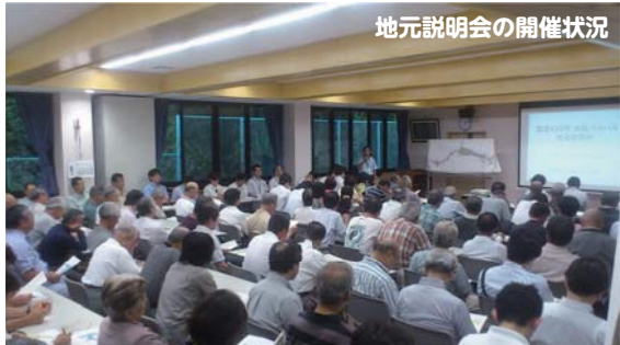
地元説明会の開催状況

道路整備計画案の作成にあたっては、地元住民からなる「国道432号(鼻曲・大庭地内)道路整備専門委員会」「国道432号古志原工区道路整備委員会」の皆様にご検討、調整いただきました。また、検討の各段階で地元説明会等を開催し、広くご意見を頂きながら計画案をまとめました。