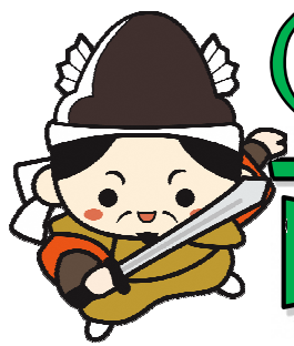
江津市PRキャラクター 「人麻呂くん」