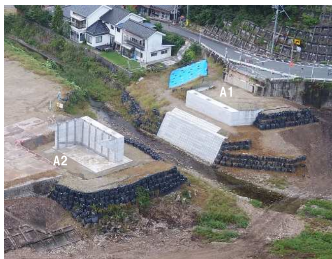
A1,A2 橋台完成 (R7.10)

令和6年10月から施工を進めていたA1橋台が7月31日、A2橋台が10月10日に完成しました。当初開通予定時期を令和8年夏頃とお知らせしていましたが、A2橋台の杭の掘削工法見直し等により4ヶ月程度の遅れが発生しており、令和8年12月頃となる見込みです。開通時期の遅れにより、引き続きご迷惑をお掛けしますが、ご理解とご協力のほどよろしくお願いします。