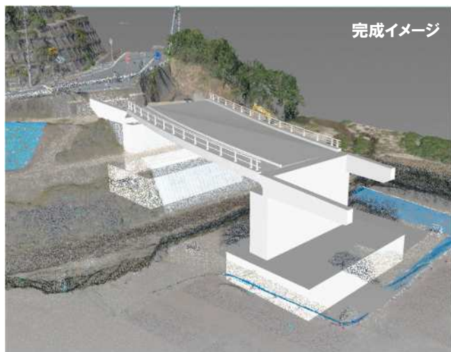
工事内容：橋梁上部工