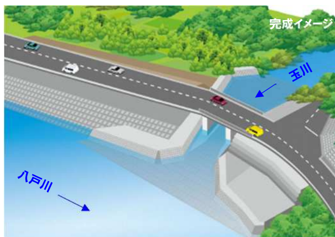
工事内容：護岸工事、擁壁工事、盛土工事