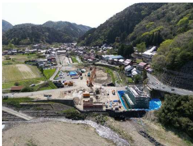
A1, A2 同時施工状況 (R7.3)