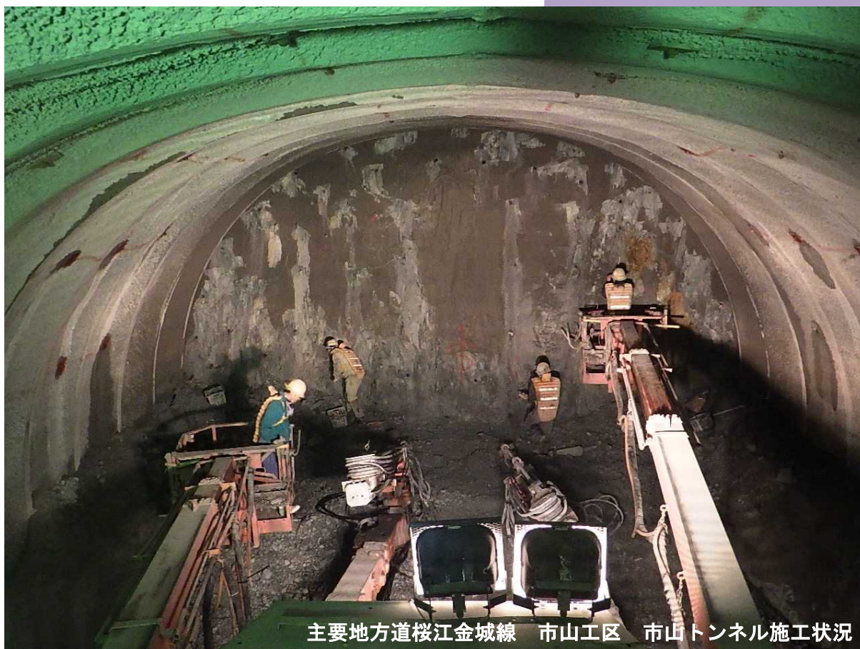
主要地方道桜江金城線 市山工区 市山トンネル施工状況