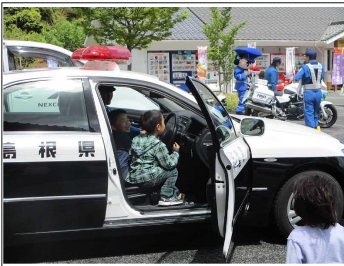
（写真：パトカー試乗の様子）