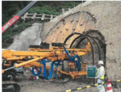
施工状況(掘削開始)

(主) 桜江金城線 市山工区『市山トンネル』は、施工事例の少ない“側壁導坑先進工法”を採用しています。