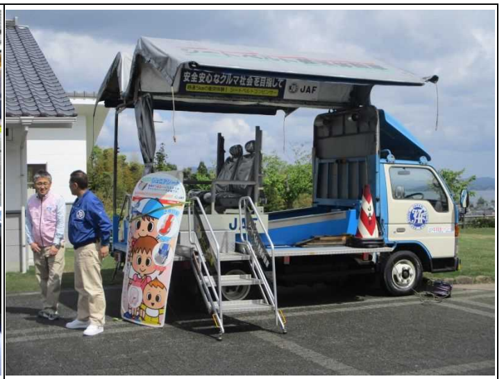
（写真：JAFの模擬衝突体験車）