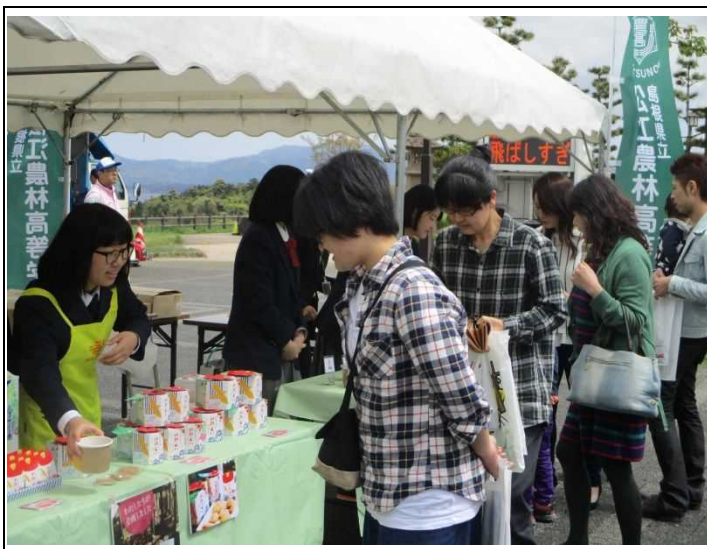
（写真：松江農林・松江商業高校による商品販売）