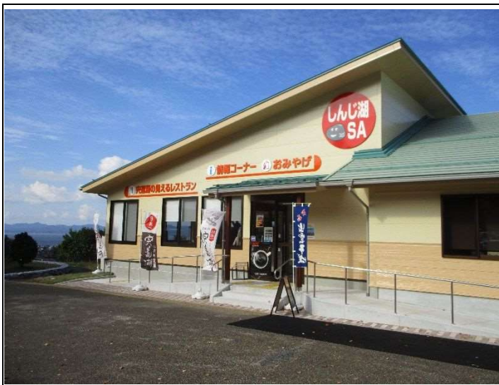
（今年8月に「宍道湖の見えるレストラン」が増設されました）