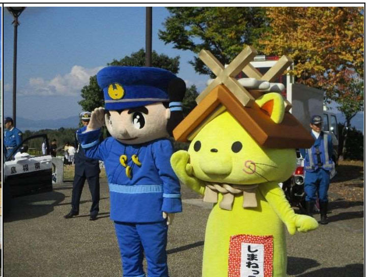
（しまねっことみこぴーの2ショット）

例年、島根県内でも冬用タイヤ未装着車両による走行不能やスリップ事故、スリップした車両が道路を塞ぐために起こる交通障害が多く発生しています。