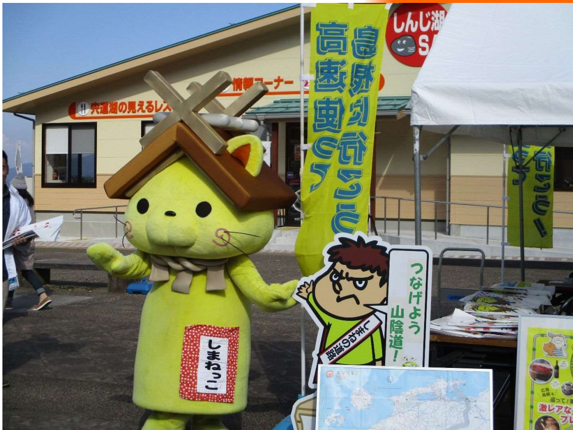
2017「秋の交通安全&冬用タイヤ装着キャンペーン in 宍道湖SA」