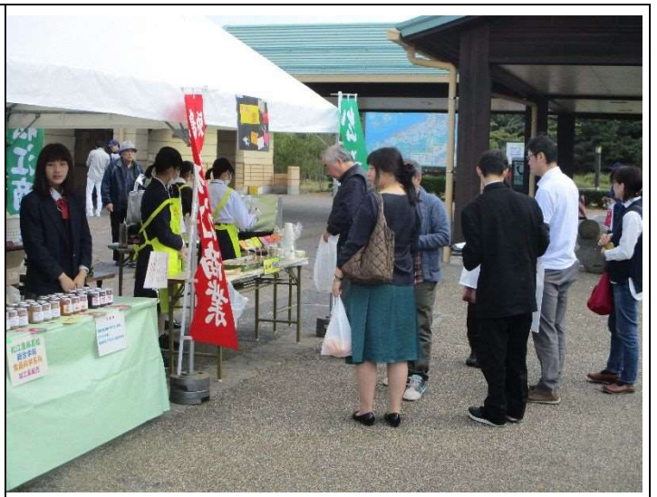
（松江農林・松江商業のブース也大盛況！）