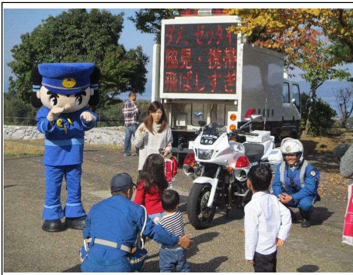
（白バイの試乗には多くの方が興味津々）

当日は秋晴れの空のもと、高速隊パトカーや白バイ、管理隊パトカー等の展示や、島根県立松江農林高校及び松江商業高校の生徒の皆さんによるオリジナル商品の販売等が行われました。3連休の初日ということもあって、多数の方々に来場いただきました。