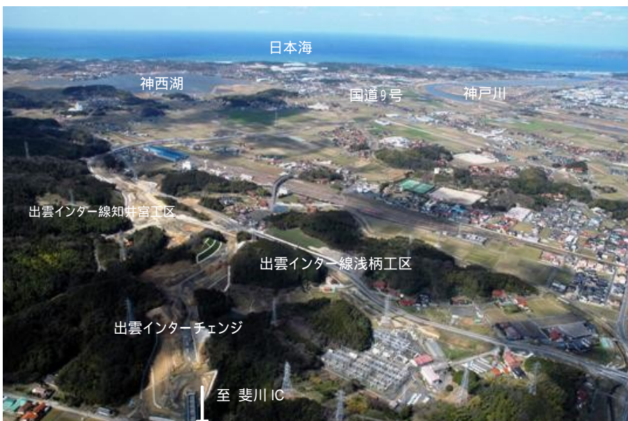
平成21年3月15日現在の出雲インター線周辺の様子

また、左の写真は出雲IC周辺を空から見た様子です。インターチェンジへのアクセス道となる一般県道出雲インター線の整備も開通に向けて、出雲県土整備事務所により進められています。