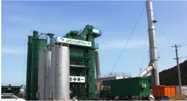
出雲市上塩冶町に建設された「くにびきハイウェイプラント」