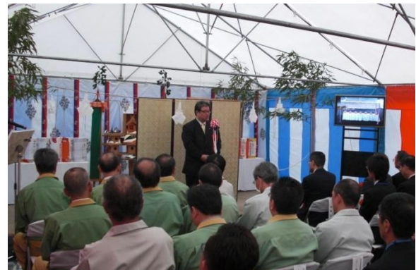
式典で挨拶する西野県土木部次長