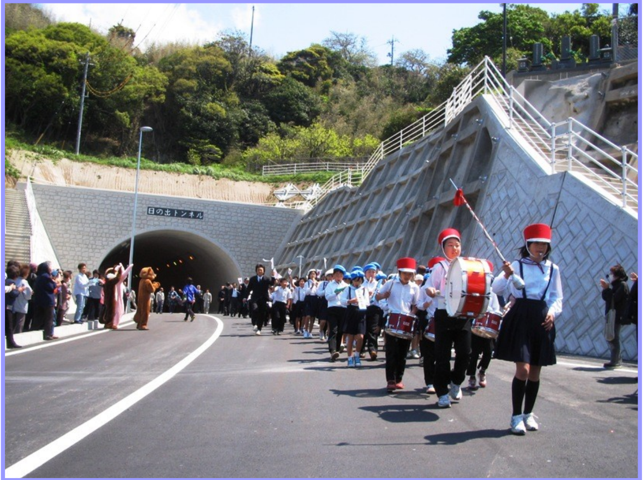
浦郷漁港臨港道路（隠岐郡西ノ島町大字浦郷地内）