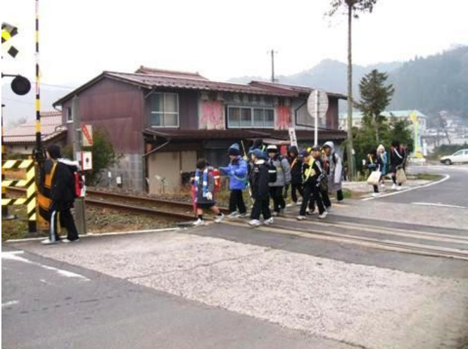
(整備前) 苗手下踏切部