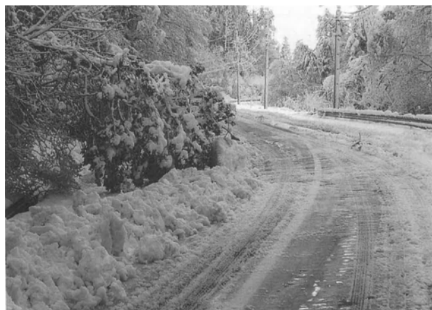
↑雪の重みで木が倒れ、非常に危険です。