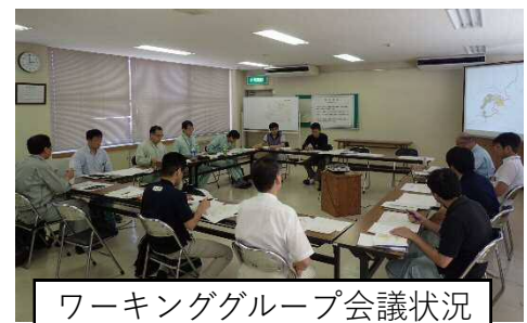
ワーキンググループ会議状況

県央管内にある1市3町のうち1市2町で林業事業体、市町、森林管理署、林業公社、農林振興センター、県土整備事務所などが集まり、ワーキンググループ会議を昨年度から開催しています。会議の内容は、候補地の選定、森林資源量の調査、現地調査、森林施業の予定、地元の意向、市町の負担、県の予算などの情報交換、調整を行い、路線、概略線形の決定を行いました。