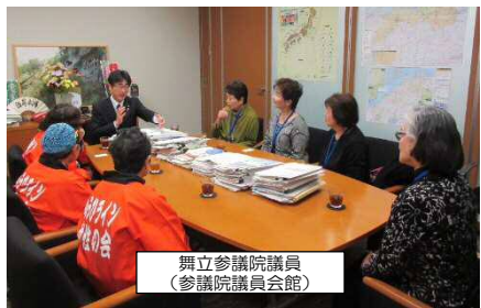
舞立参議院議員 (参議院議員会館)