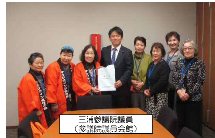
三浦参議院議員 (参議院議員会館)