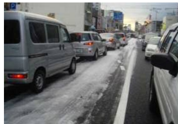
車の立ち往生による渋滞