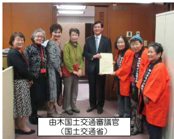
田木国土交通審議官 (国土交通省)