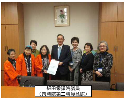
細田衆議院議員 (衆議院第二議員会館)