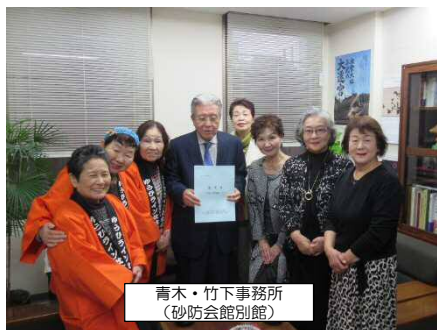
青木・竹下事務所 (砂防会館別館)