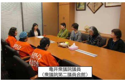
亀井衆議院議員 (衆議院第二議員会館)