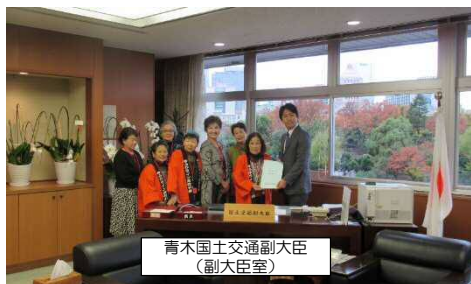
青木国土交通副大臣 (副大臣室)

県内の山陰道の供用率は67%であり、山陰道の早期全線開通には、このような女性の会の活動が不可欠であり、引き続き力強い後押しをお願いしたいです。