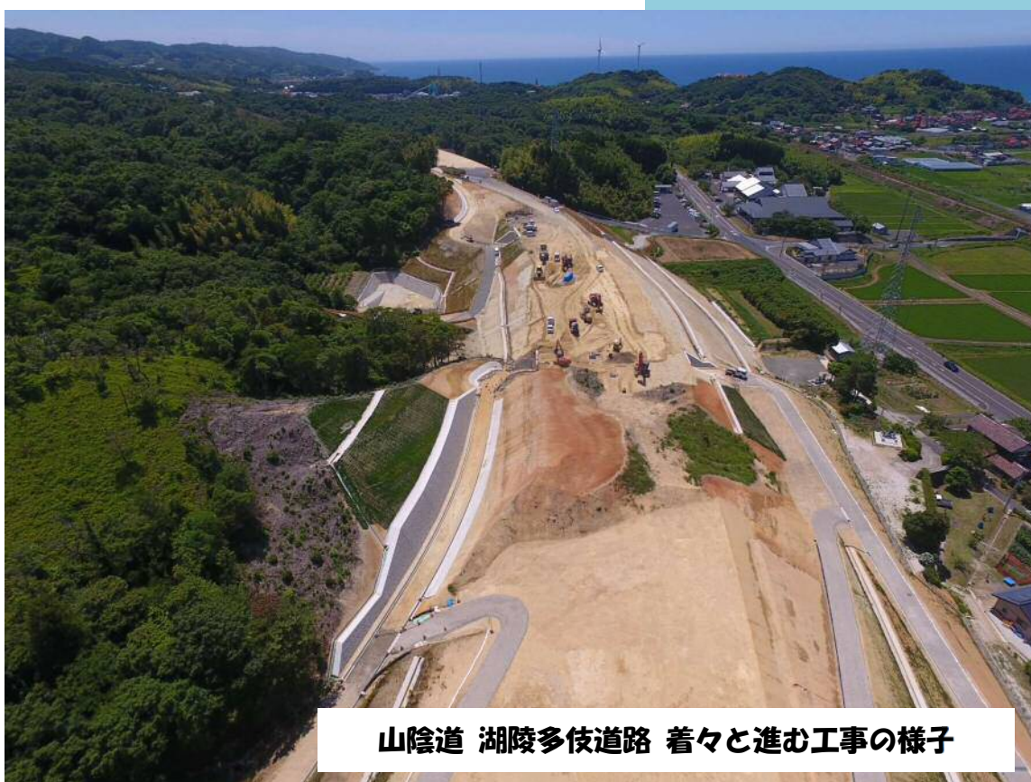
山陰道 湖陵多伎道路 着々と進む工事の様子