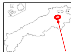
国道 54 号三刀屋拡幅