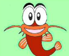
【しまねの農業農村整備すごろく】キャラクター 「ドジョウのどうじよ君」

今年度の橋脚のコンクリート巻き立て工事の様子を facebook「ご縁の国しまねの建設」に不定期投稿しているよ。 見てみてね。