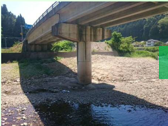
平成27年度工事着工前