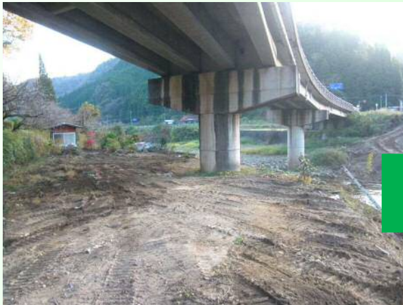
平成26年度工事着工前