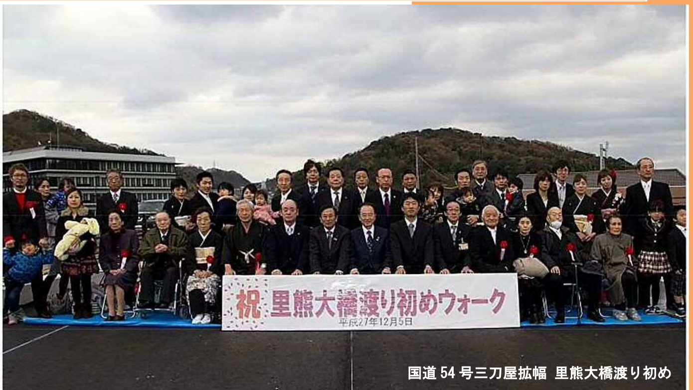
国道 54 号三刀屋拡幅 里熊大橋渡り初め