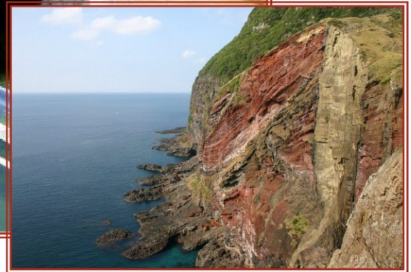
一般県道 知夫島線 郡工区