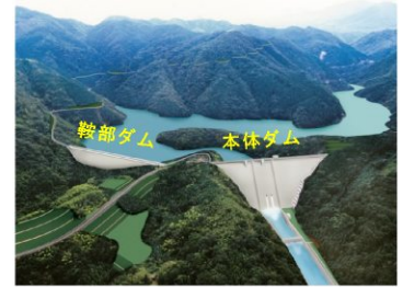
第二浜田ダム完成予想図

引き続き、全線開通に向け工事を進めていきますので、ご協力いただきますようお願いします。