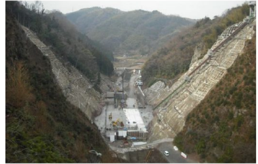
第二浜田ダム 現在の状況