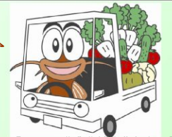
『しまねの農業農村整備すごろく』 キャラクター ドジョウのどうじよ君

平成5年度から整備してきた邑智中央農道が、この春全線開通するので紹介するよ～。 ※開通は3月の予定です。