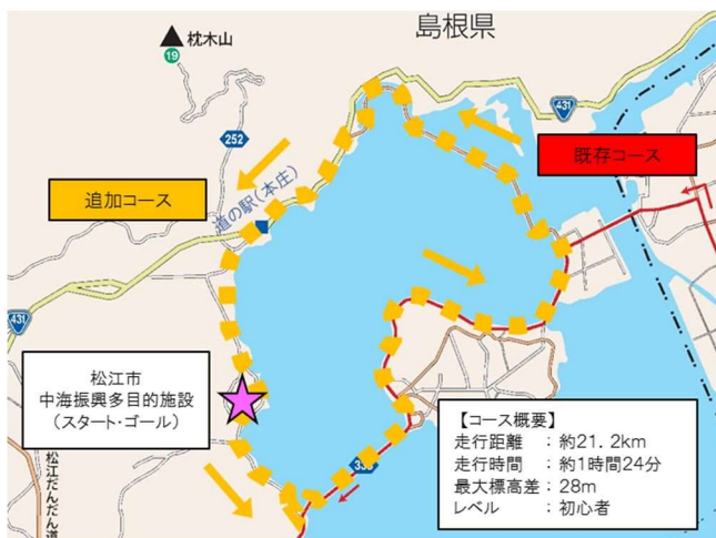
(仮称) 中海北部周遊サイクリングコース (追加コース)

今後、路面標示等の整備を行うとともに、ホームページやパンフレットにおいて追加コースの周知を図っていきます。