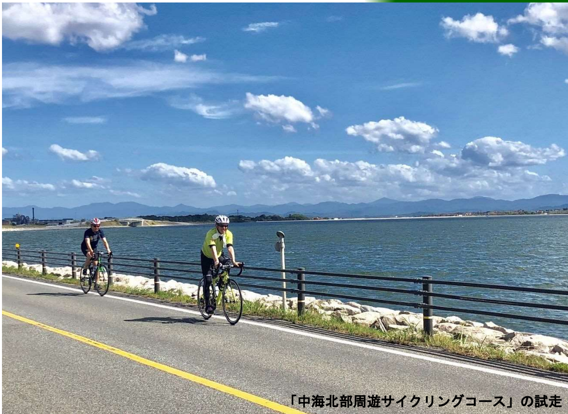
「中海北部周遊サイクリングコース」の試走