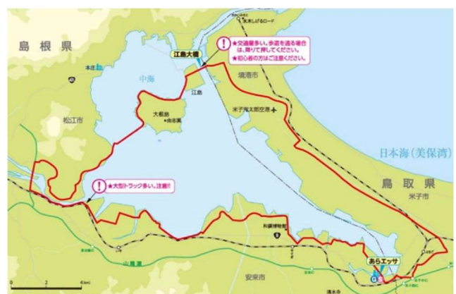
中海周遊サイクリングコース (既存コース)