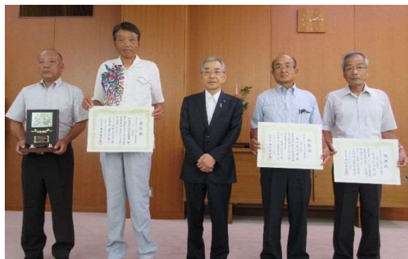
左から、阿用地区振興協議会(河川)、知事、柿原自治会、坂浦自治会

道路脇の草刈を10年以上継続して熱心に取り組んでおられます。草刈り機等を使い効率的に作業し地域の環境整備に大いに貢献しておられます。