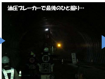
油圧ブレードで最後のひと掘り...