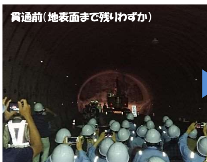
貫通前(地表面まで残りわずか)