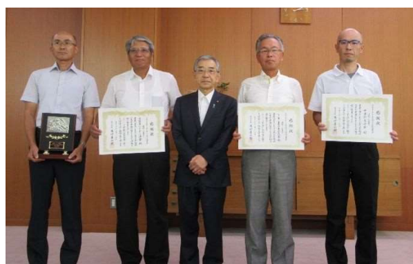
左から：出雲市バレーボール連盟(公園)、知事、ハート♥フル♥案内・案内自治会、中遠所自治会