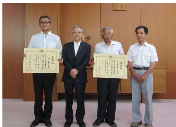
左から、中ノ手自治会、知事、上講武トラクター組合