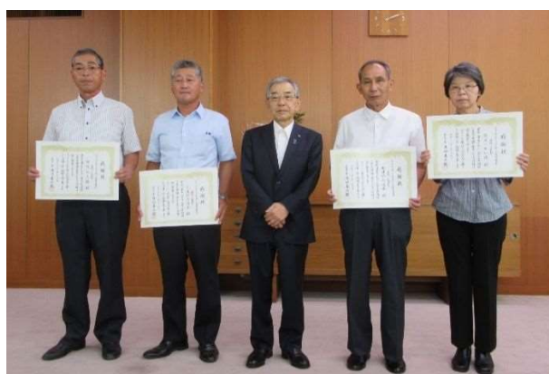
左から：須所公民館、下遠所自治会、知事、奥遠所自治会、おせっかい隊

高齢化が進むなか、草が繁茂する期間に年3回の活動を行っておられます。作業延長が長いため分担しながら効率よく進むよう活動し、環境維持に大いに貢献しておられます。