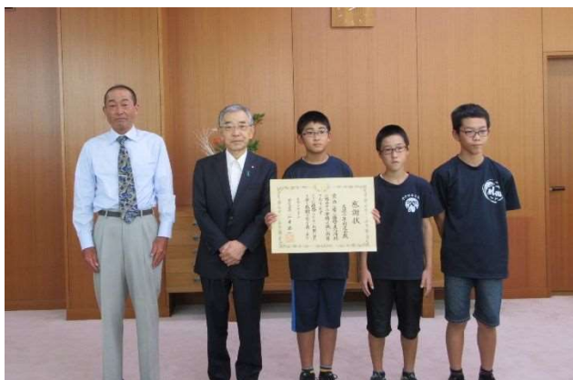
溝口知事と記念撮影をされる代表者の方々。 忌部少年剣道会、知事

国土交通省では、8月の「道路ふれあい月間」中に「道路交通の安全、道路の正しい利用、道路愛護等に努めその功績が特に顕著な民間の団体または個人に対する表彰」という名称の国土交通大臣表彰を行っています。 島根県からは3団体が表彰されました。