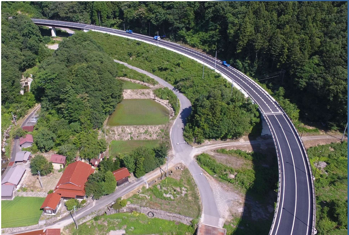
(一) 柿木津和野停車場線 中座工区