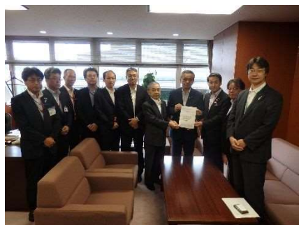
国交省 高橋大臣政務官への要望