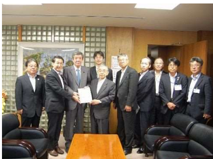
自民党 竹下総務会長への要望