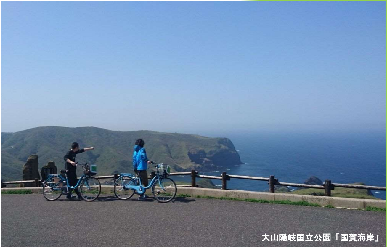
大山隠岐国立公園「国賀海岸」