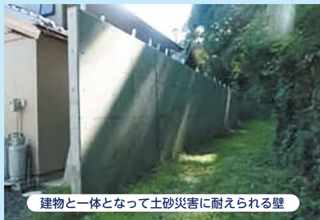
建物と一体となって土砂災害に耐えられる壁