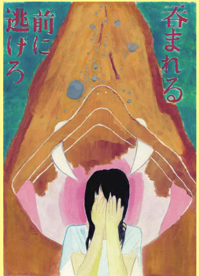
「命の危険が来る前に」