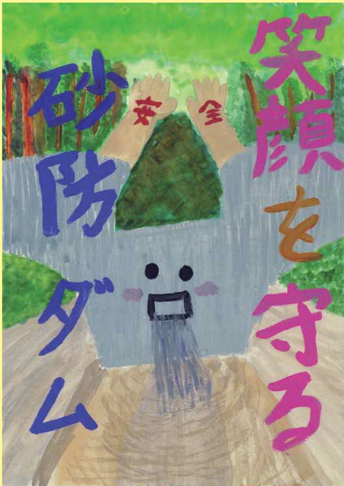
「笑顔を守る砂防ダム」