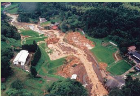
平成9年出雲市奥宇賀町