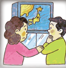
大雨の時は防災情報に注意!