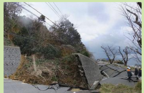
平成28年出雲市多伎町