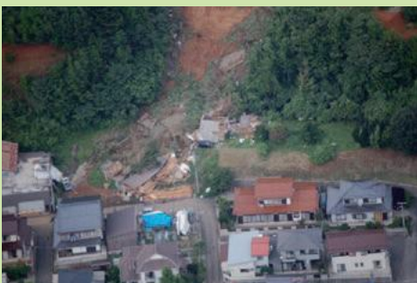
平成19年隠岐の島町

比較的緩やかな斜面で、地下水の影響などにより斜面がゆっくりと動き出します。一度に広い範囲が動くため、被害も大きく、川をせき止め洪水を引き起こすこともあります。