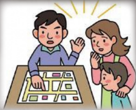
家族で危険箇所、避難場所を確認!

お住まいの町のハザードマップで、危険な箇所、避難場所、避難経路を確認しておきましょう。防災情報や避難情報に注意して、早めの避難を心掛けましょう。