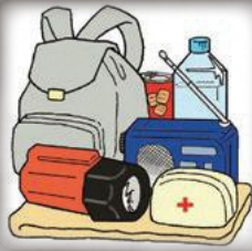
非常時の持ち出し品を確認!