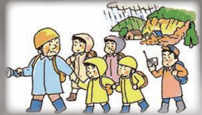
ご近所と声をかけあって、みんなで避難!