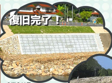
3災241号 施工：(有)香川建設