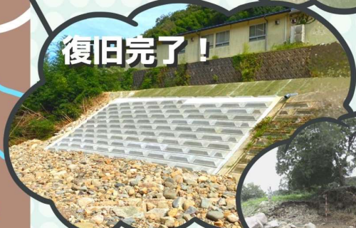
3災242号 施工：(有)香川建設