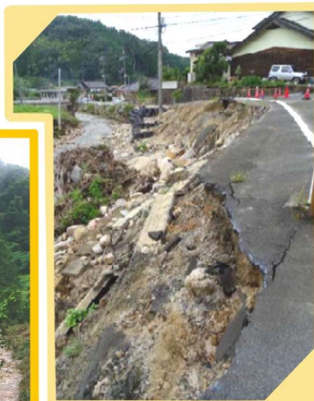
↑3災262号 飯石川 (三刀屋町多久和)