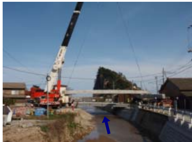
左岸からの桁架設 「H21.03.04 撮影」