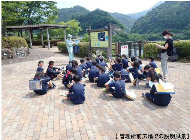
【管理所前広場での説明風景】