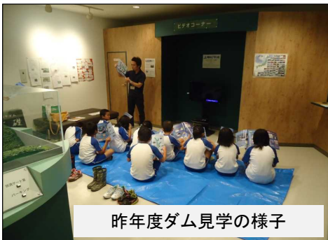
昨年度ダム見学の様子

中条小学校や西郷小学校など、毎年地元の小中学生に銚子ダム見学に来ていただいています！