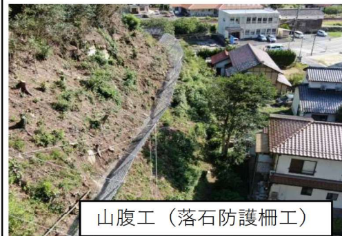
山腹工（落石防護柵工）