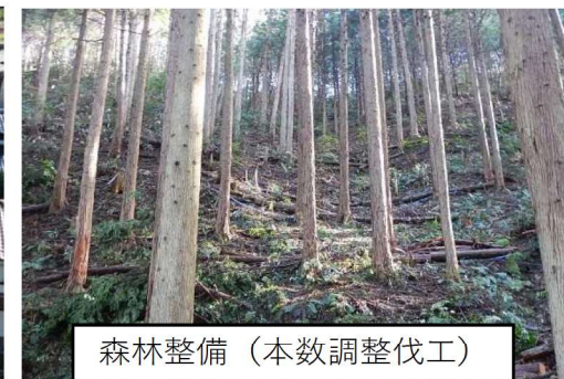
森林整備（本数調整伐工）