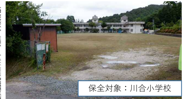
保全対象：川合小学校