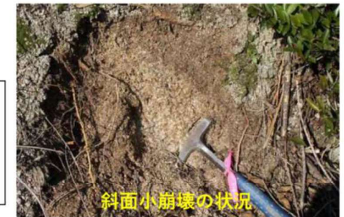
斜面小崩壊の状況