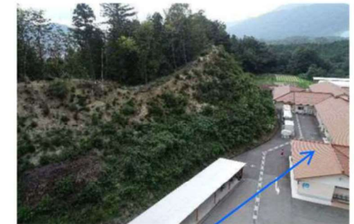
障がい者支援施設 愛香園