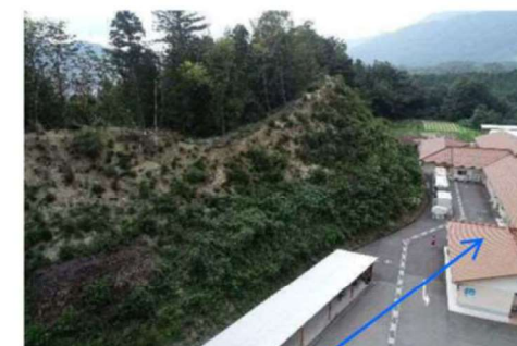
障がい者支援施設 愛香園