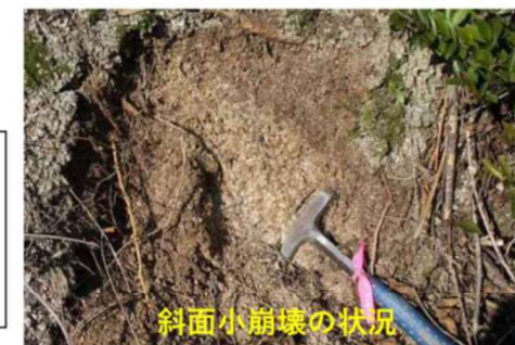
斜面小崩壊の状況