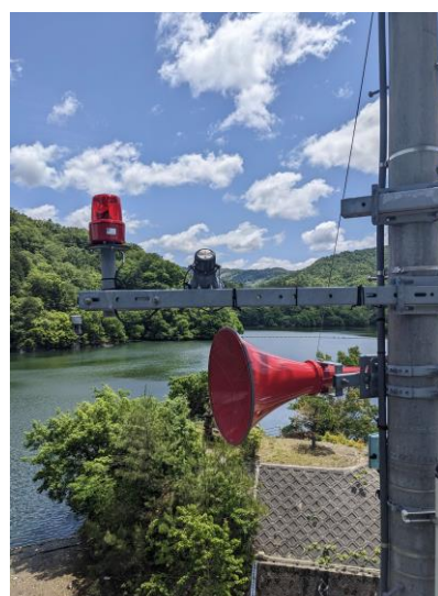
放送用スピーカー・回転灯