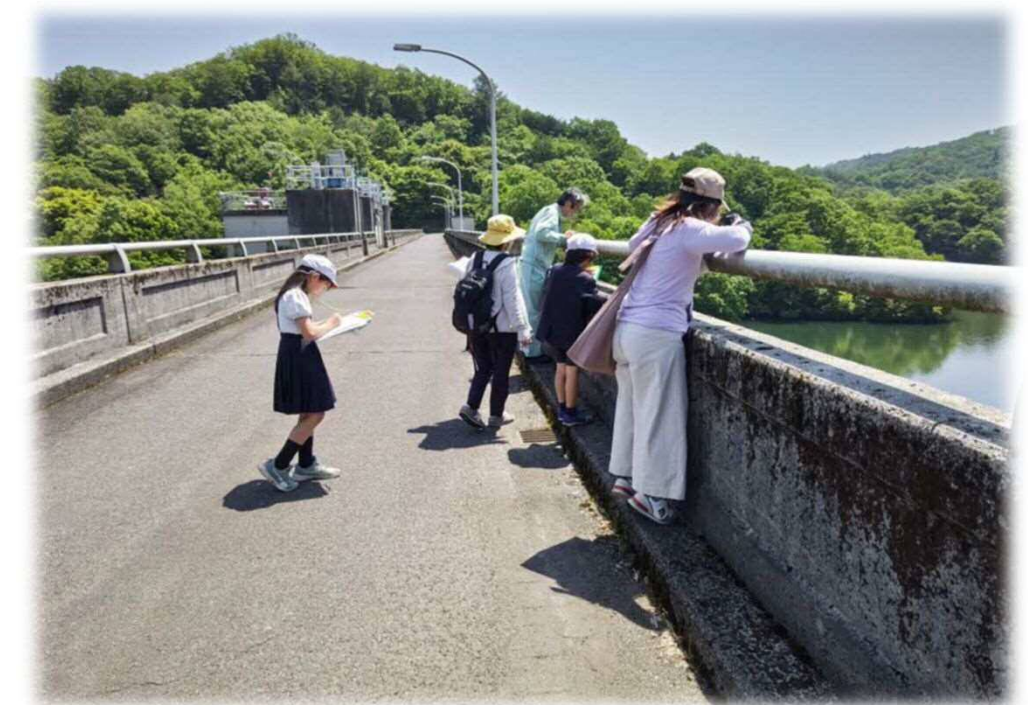
ダム天端道路からダム貯水池の広さや ダムからの放流について見学