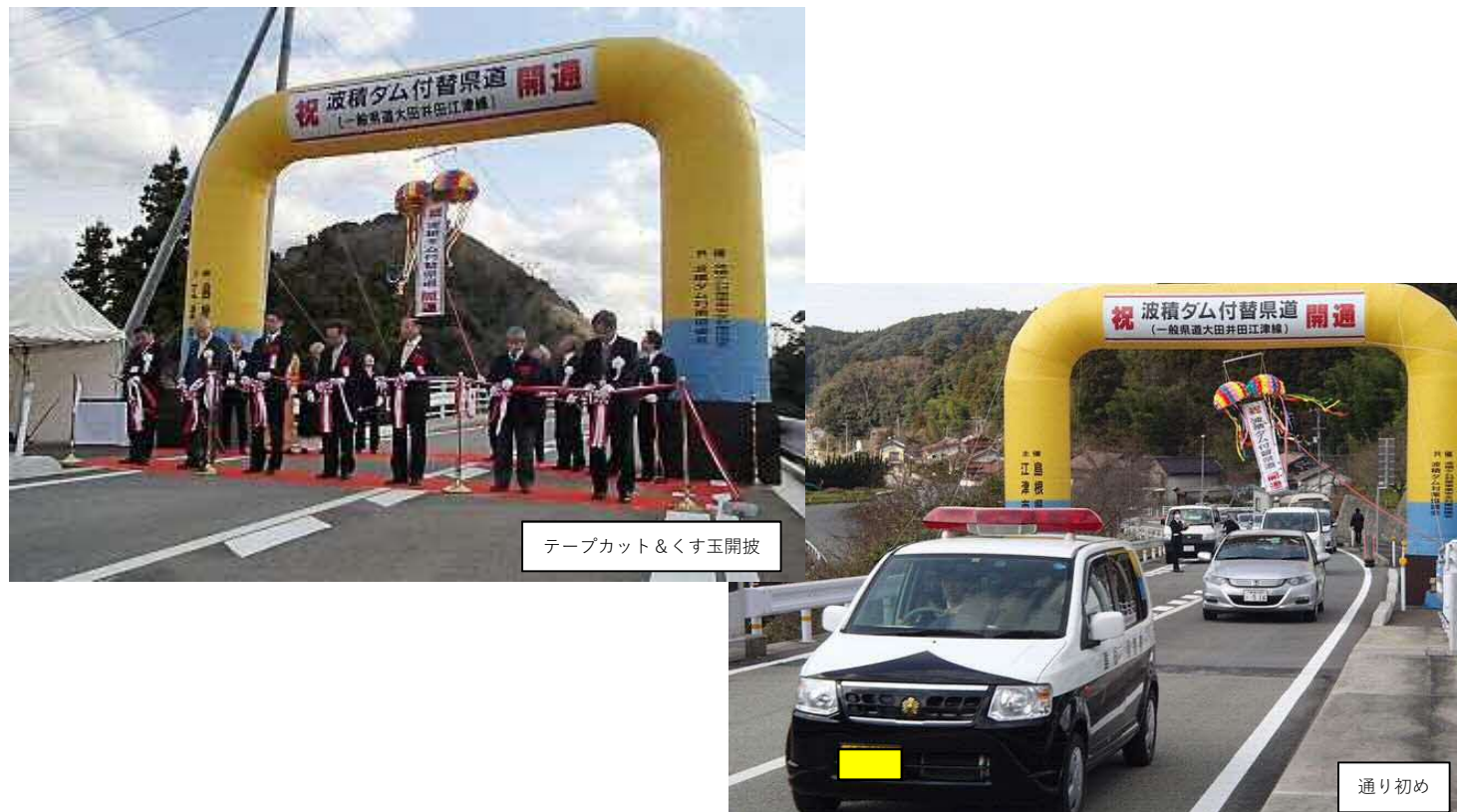
テープカット&くす玉開披

開通を祝して、平成31年1月25日、付替県道大田井田江津線の開通式が行われました。付替県道の工事は、平成15年度から平成30年度までの16年の歳月と約27億円の予算を投じて、橋長78mの弓場大橋を含む2つの橋梁や、高さ40mを超える法面構造物等の工事を行い、この度の完成をむかえました。整備により道のりが2.5kmから2.1kmと0.4km短縮され、移動時間にすると約3分短くなり、通行車両の安全性や利便性が向上して地域間交流が活発になるものと期待されます。