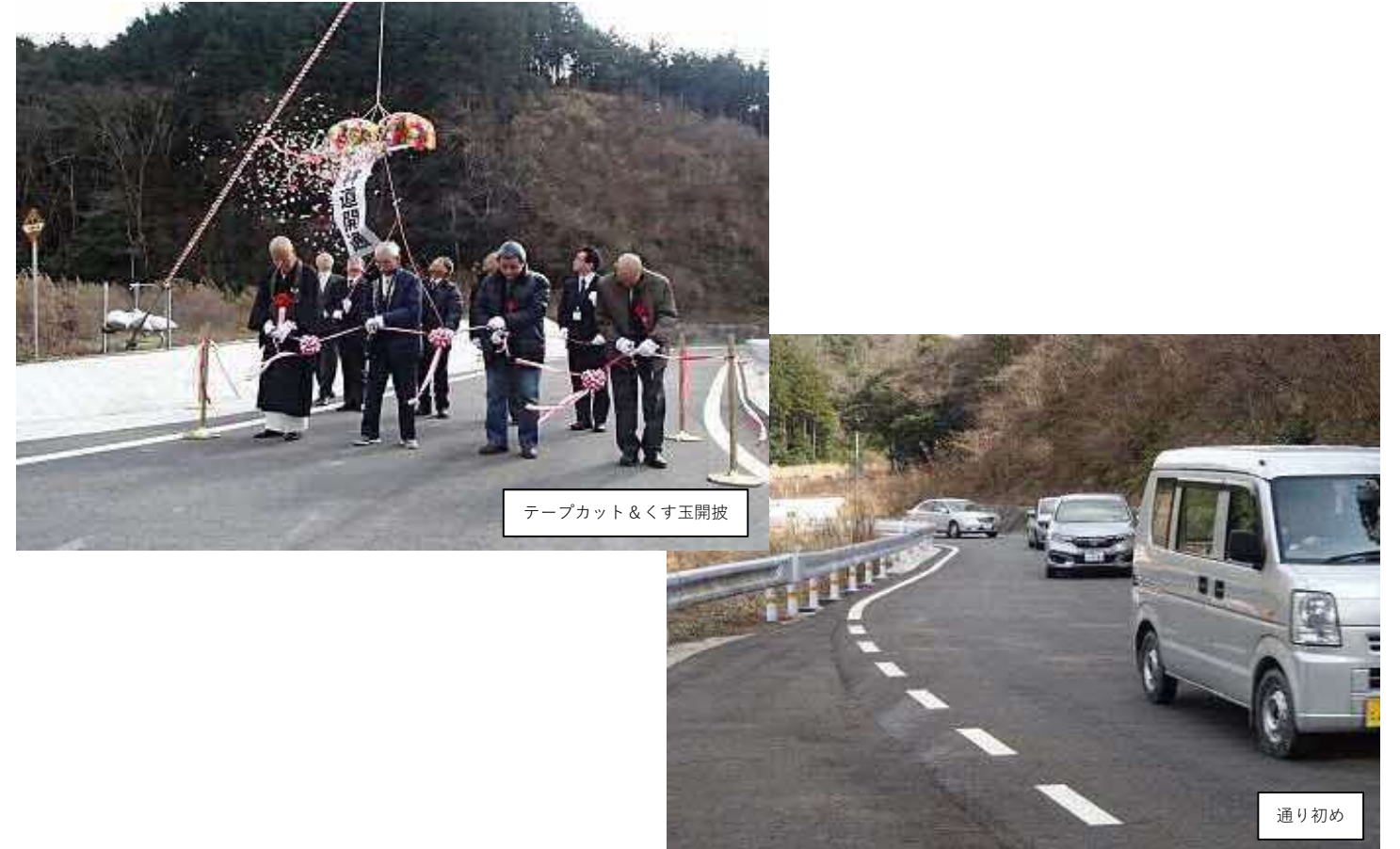
テープカット&くす玉開披

開通を祝して、平成31年1月25日、付替林道岩瀧寺線の開通式が行われました。今回開通するのは延長0.8kmの区間ですが、この終点部には「江津市指定文化財」である「岩瀧寺の滝」があります。この度の林道の整備により利便性が増し、「岩瀧寺の滝」への観光客が益々増加するものと期待されます。