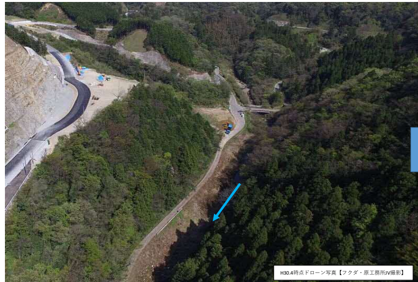
H30.4時点ドローン写真

波積ダム本体建設工事は平成30年12月14日に本契約を行い、今春には現地着手を行う予定です。ダム本体建設工の施工は、①仮締切工⇒②基礎掘削工⇒③堤体工、基礎処理工⇒④閉塞工の手順で進めていきます。また、波積ダム本体工事と平行して取水放流設備工事も施工を行います。