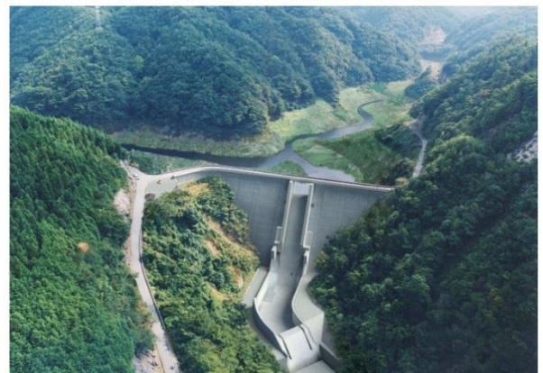
浜田ダム再開発完成予想図