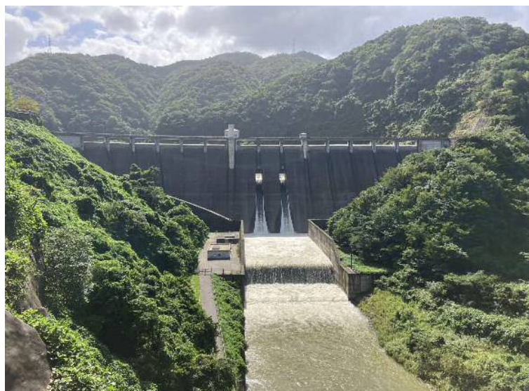
台風14号通過後の様子