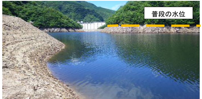
渇水時の状況(湖面)