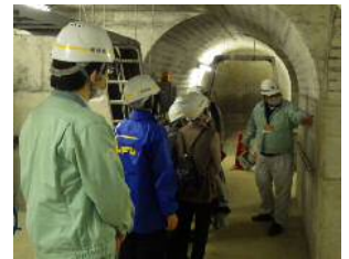
※大長見ダム見学会の様子

説明後には、皆さんから笑顔で「ありがとうございました。」という言葉いただき、大変うれしく思いました。