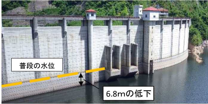
渇水時の状況(堤体)

5月以降は例年に比べ降水量が少なく、5月から7月の大長見ダム流域平均総雨量は過去5年で1番少ない年となり、渇水の状態となりました。大長見ダムでは、河川の流量が少なくなったため、5月31日から8月19日までの間、ダムから用水補給を実施しました。この用水補給によって大長見ダムの貯水位は最大で6.8mほど下がり、ダムが用水補給に利用することのできる水の貯水量は52.7%まで減少しました。ここまで水位が低下したのは過去2番目となります。