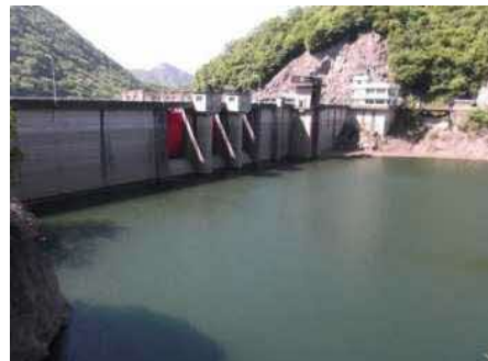
げんざい すい い 現在の水位(平成26年5月15日)