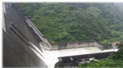
※H30年7月7日撮影 (常用洪水吐きの様子)

H30年度も西日本各地で大雨が降り、大きな被害をもたらしました。写真はH30年7月7日に撮影したものであり、 常用洪水吐き(2ヶ所の穴) から激しく水が流れている様子が分かります。紅葉湖も水が濁っており、上流から流木が流れてきました。