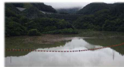
※H30年7月7日撮影 (紅葉湖の様子)