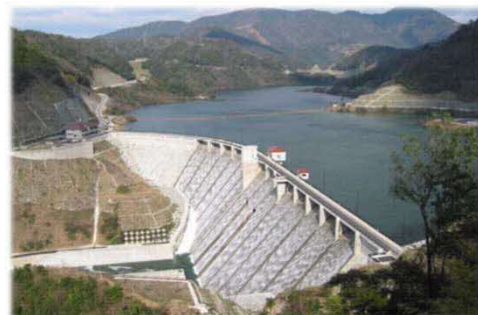
※非常用洪水吐から越流する様子 (H15試験湛水時の写真です)

また上空で厚い雲が急激に発達したり、あるいは雷が頻繁に鳴り始めた時などは局所的に突然大雨が降り出すことも少なくありません。上空で黒い雲が発生したり、雷が鳴ったりしたら河川の増水に注意しましょう。