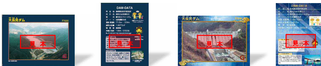
※通常のダムカード