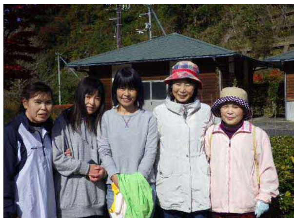
※ウォーキングに参加されたみなさん