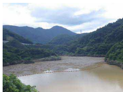
※大長見ダムに溜まった流木状況