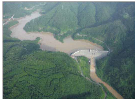
※7月5日当日の大長見ダム

5日早朝には浜田市で県内初となる「大雨特別警報」が発令されました。また、周布川では中場水位局で「氾濫危険水位」を超えたため、下流域で避難指示が発令されました。