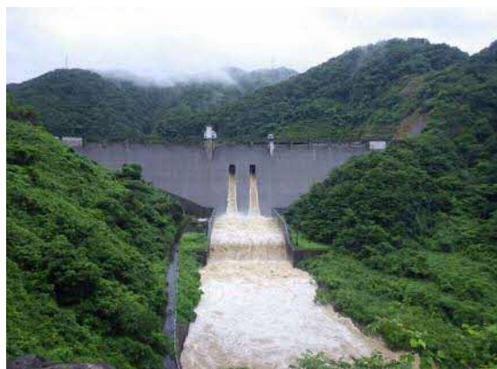
※7月5日大長見ダムからの放流状況

大長見ダムでも総雨量が319mmに達し、管理開始から過去最大となる流入量（ダムに入ってくる水の量）約596m 3 /sがあり、約500m 3 /sの流量をダムに貯めることで下流での流量を低減しました。これが ダムの洪水調節機能 と呼ばれるもので、今回はその機能を発揮することができました。