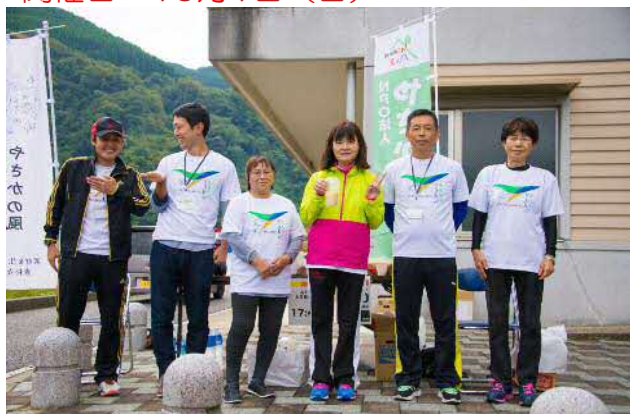
※大長見ダム給水所のボランティアのみなさん

○秘境奥島根やさかウルトラマラニックin浜田2017 100kmマラソンコースに大長見ダム周辺が含まれ、大会が開催されました。 開催日：10月1日（日）