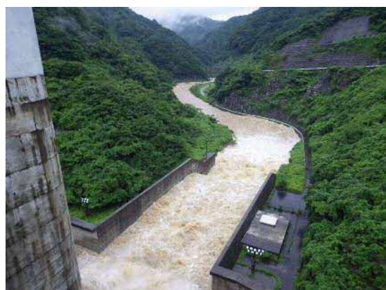
※7月5日大長見ダム直下流の様子

この洪水調整により、下流の中場水位局では、ダムがなかった場合に比べ91cmの水位低下ができたものと考えられます。