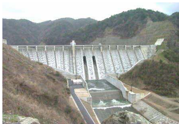
※非常用洪水吐から越流の様子 (試験湛水時の写真です)