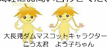
大長見ダムマスコットキャラクター こう太君 よう子ちゃん