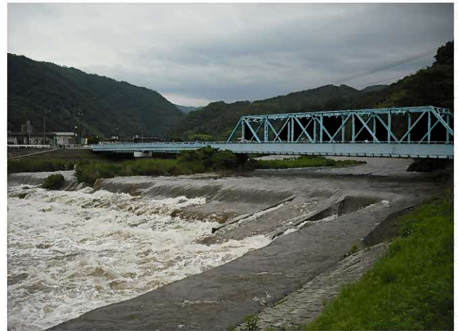
8月23日からの大雨の時の周布川（松本橋）の様子