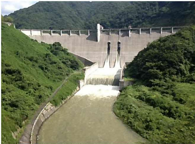
8月23日からの大雨の時の放流の様子