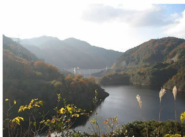
11月の紅葉湖の様子（奥に見えるのがダム本体）