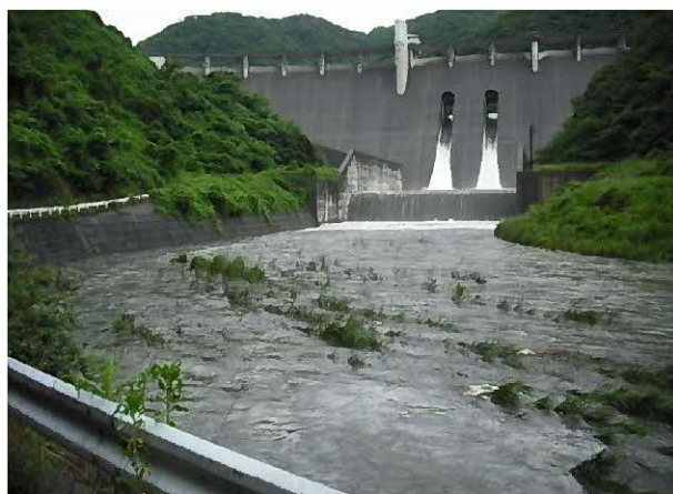
6月19日からの大雨の時の放流の様子

大長見ダム上流でも例年比べて降雨が多く、総雨量200mmを超えた大雨が6月19日～21日と8月23日～25日の2回ありました。通常、総雨量200mmを超えることは1年に1回あるかどうかという程度であり、1年に2回もあったのは平成18年度以来です。また、大雨時の対応のための洪水警戒体制は通算11回配備を行いました。