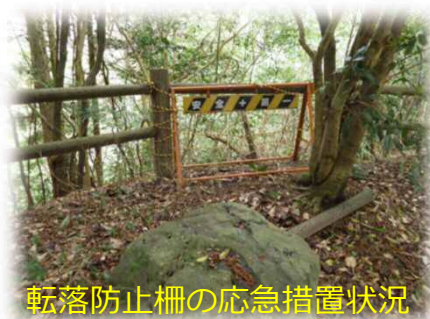
転落防止柵の応急措置状況