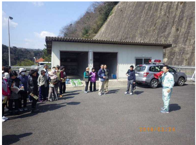
(ダムの役割を説明中)

また見学会の思い出として、ダムカードをプレゼントしました。見学会は、ダムを身近に感じていただく良い機会となっています。事前に連絡いただき、ダム見学に来て下さい。また、出前講座にもお伺いします。