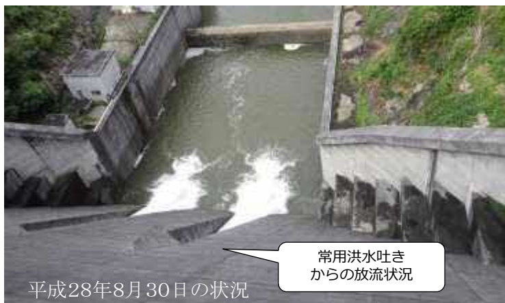
平成28年8月30日の状況