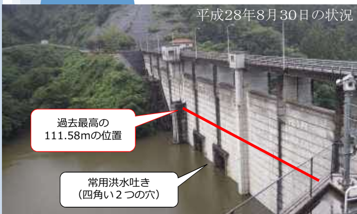
平成28年8月30日の状況

洪水警戒体制では、ダムごとに定められた気象条件を満たした場合、時間帯を問わずダム管理所に職員が詰めることとなります。