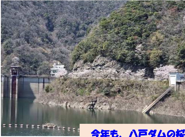
今年も、八戸ダムの桜は満開でした