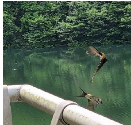
今年も、コシアカツバメがたくさんいます