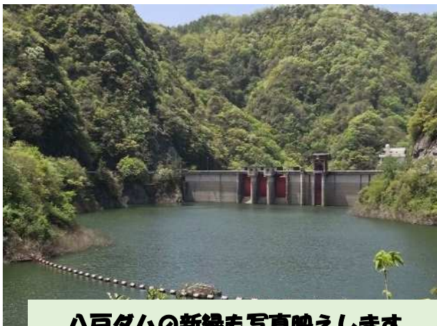
八戸ダムの新緑も写真映えます