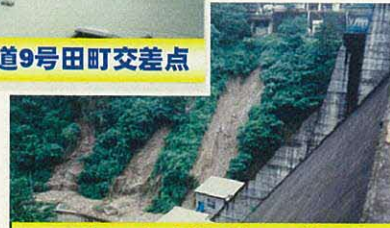
昭和63年 浜田ダムの様子

毎年6月16日から9月30日までの期間は、大雨が降る可能性が高い洪水期です。 近年は時間雨量が20mmを越えるような激しい雨が多くの場所で記録されていますので、大雨に注意してください。