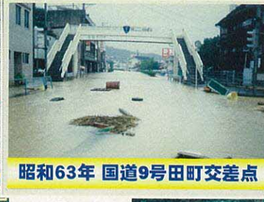
昭和63年 国道9号田町交差点