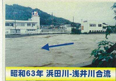
昭和63年 浜田川-浅井川合流