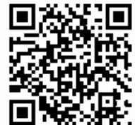
第二浜田ダム 水防情報QRコード