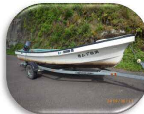
ダム湖巡視に使う船