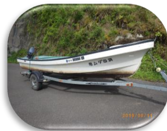
ダム湖巡視に使う船